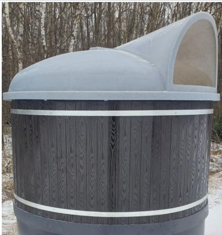
ДПК или МПК (полимер) 30 000 Р с НДС