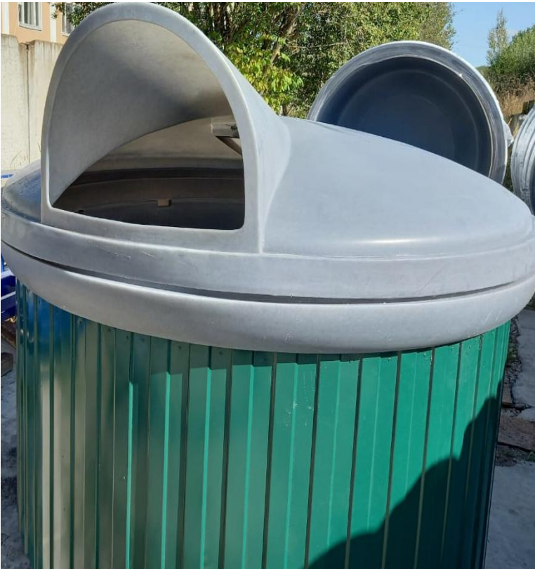
Профлист С8 20 000 Р с НДС