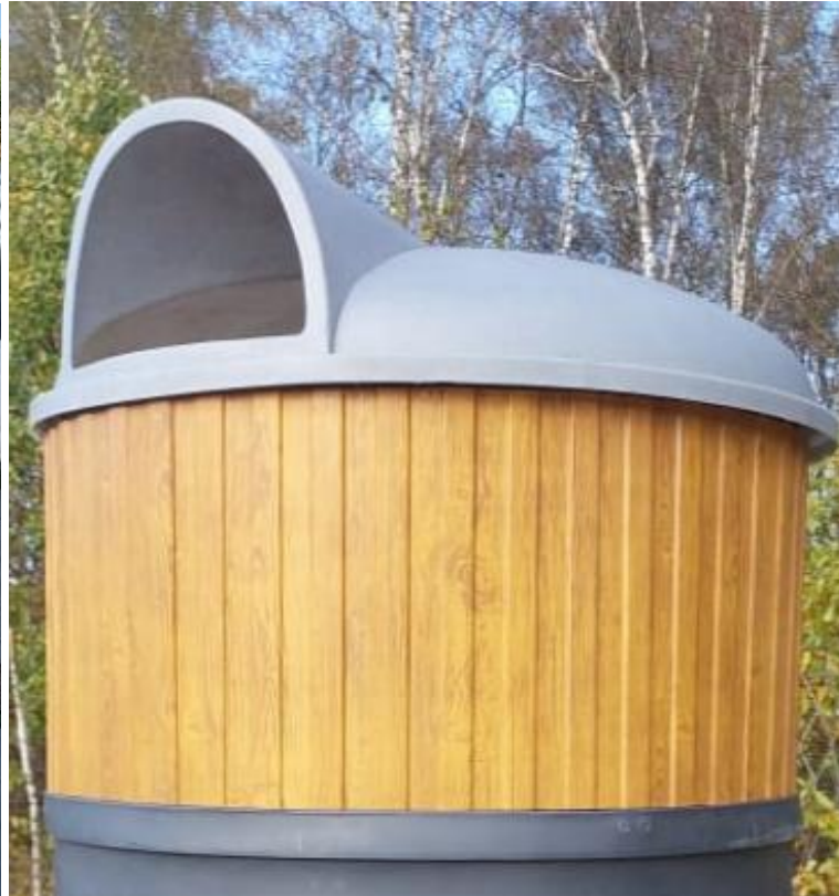
Профлист С8 (имитация дерева) 25 000 Р с НДС