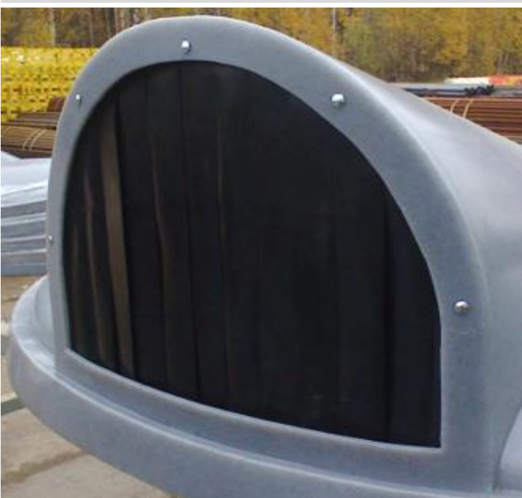
Резиновые шторки 6 000 Р с НДС