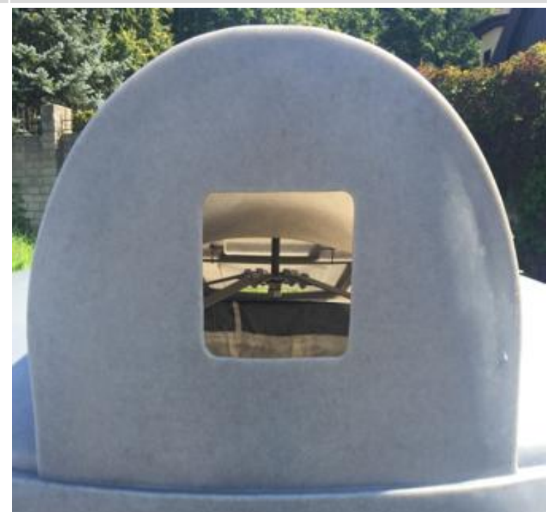
Любое отверстие (селективный сбор) 0 Р с НДС