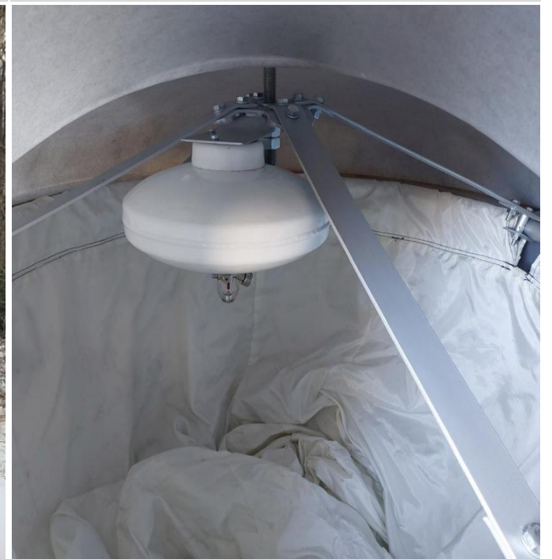
Автономное пожаротушение 16 000 Р с НДС