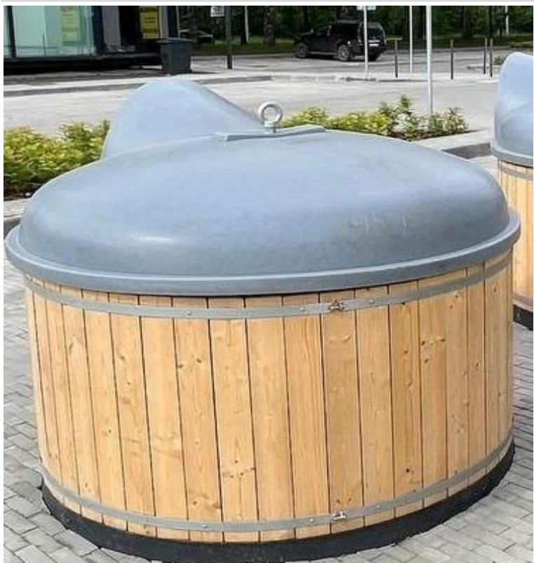
Натуральное дерево 27 000 Р с НДС