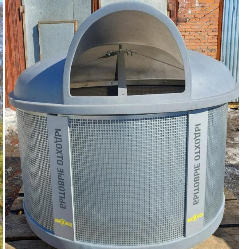
Перфоллист оцинкованный 30 000 Р с НДС