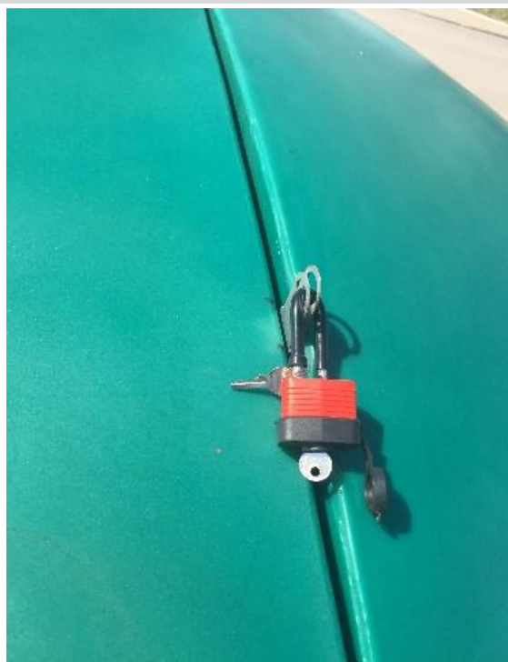
Замок на лючке 1 600 Р с НДС