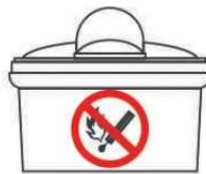
Система автономного пожаротушения