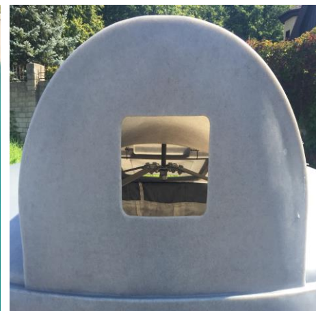
Любое отверстие, селективный сбор – 0,0 ₽ / 1 шт.