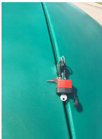
Петли с замком на люке – 1 000,00 ₽ / 1 шт.