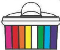
Цвет контейнера и крышки под заказ