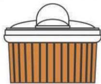
Деревянная или пластиковая облицовка