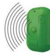
Датчик накопления ТКО

Дерево: 25 000,00 ₽ / 1 шт. Перфолит оц.: 24 000,00 ₽ / 1шт. ДПК: 45 000,00 ₽ / 1шт.